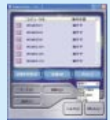
ネットワーク内のパソコンの状態を確認

* 他のパソコンへのタイマー(起動/終了時間)の設定はできません。 * 電源のリモート操作をおこなう場合は、対象となるパソコンがWake Up On LAN機能に対応している必要があります。また、設定の変更が必要になる場合があります。02夏BIBLOシリーズのWake Up On LAN機能への対応は、MR/NE/NBシリーズでは、待機状態がスタンバイ状態まで有効となります。また、MG/LOOXシリーズではWake Up On LAN機能に対応していません。