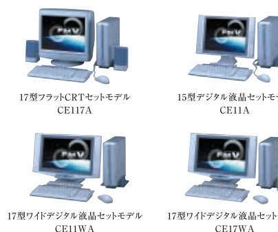
*マークの説明は P.36をご覧ください。*周辺機器との接続はP.08をご覧ください。

*写真、画像などはハモミ合成です。*写真のパソコンはFMV-DESKPOWER CE11Aです。機種により機能が異なります。P.37でご確認ください。*1 横置きは可能ですが、本体の上にディスプレイなどを載せることはできません。また、設置の際はフレキシブルベース™(設置台)をご使用ください。*2 CE117Aを除く。*3 CE11WA、CE17WAのみ。*4 CE17WAのみ。*5 推奨見通し半径25m以内ですが、壁の有無など使用環境により、通信範囲は異なります。ワイヤレス(ブロードバンドインターネット接続)通信を行う場合には、別途ワイヤレスブロードバンドルーター(FMWBR-101)が必要となります。*6 音楽データの録音・複製(データ形式の変換を含む)などは、お客様個人またはご家族で楽しむ目的のみご利用ください。*7 出荷時の空き容量に節約モードで録画する場合、HDDを他の用途で使用された場合や標準/高画質モードで録画した場合、録画時間は短くなります。また、連続で録画できる時間は最長3時間です。*8 移動範囲はP.35~36の「ハードウェア仕様一覧」でご確認ください。*9 CE17WAを除く。*10 移動範囲は、距離:1m、角度:上下約20度、左右約45度ですが、設置環境や条件によって異なる場合があります。*11 ドルビーデジタル5.1チャンネル対応のアンプとスピーカーが必要です。*12 メールソフトの設定が必要となります。*13 CE11WA、CE17WAでは、i-Panelで通知するため、メール着信ランプでの通知はありません。*14 デジタルビデオカメラがIEEE1394(DV)端子を装備している必要があります。*15 本機からのデジタル出力は、サンプリング周波数48kHzのみです。48kHzに対応したオーディオ機器でご利用ください。また、音楽ソフトの著作権を保護するため、「シリアルコピーマネジメントシステム」に準拠しています。音楽データの録音・複製(データ形式の変換を含む)などは、お客様個人またはご家庭で楽しむ目的のみご利用ください。