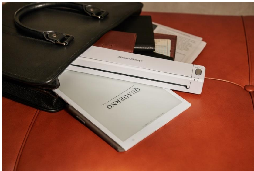
「ScanSnap iX100」での利用イメージ

「ScanSnap iX1500」「ScanSnap iX100」「ScanSnap iX500」の3機種に対応いたします※2。 「iX1500」「iX500」はWi-Fi接続に対応した屋内レイアウトフリーのモデルで、オフィス内でも自在に活躍します。 「iX100」はバッテリー駆動に対応した小型軽量モデルで、外出先や出張先へも持ち運んで活用できます。