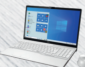
プレミアムホワイト AH42/E1のみ