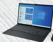
ブライトブラック