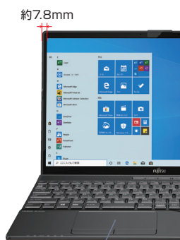
2ボタンタイプのタッチパッド

画面への没入感を高める狭額縁デザインを採用。また画面を開いた時にはキーボードが手前に向かって適度に傾斜するため、快適にキータイピングできます。さらに独立した2ボタンタイプのタッチパッドで正確な操作を実現します。