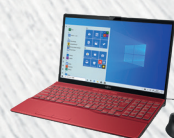
ガーネットレッド AH43/E1のみ