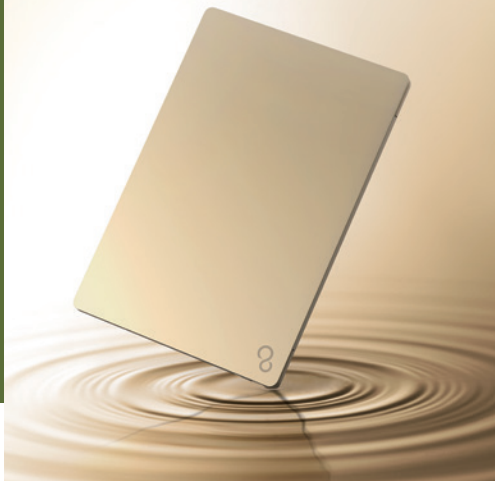
CH75/E3 ページュゴールド