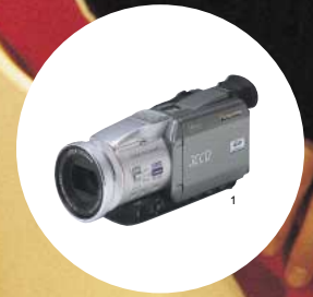
写真のパソコンはFMV-DESKPOWER C9/200WLT、デジタルビデオカメラはパナソニックNV-MX250X(別売)です。