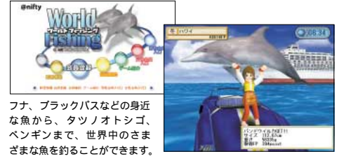
フナ、ブラックバスなどの身近な魚から、タツノオトシゴ、ペンギンまで、世界中のさまざまな魚を釣ることができます。

@niftyイチ押しのオンラインゲーム“World Fishing”。世界の川・湖・海にいる魚を釣り上げていこう。魚を釣り上げポイントを稼げば、ロッド、ルアー、ボートのクラスアップも。ボートがクラスアップすると、さらにフィールドがひろがります。ゲームの途中で出会う釣り仲間とチャットで情報を交換したり、釣った魚自慢をしたりと、ハマること間違いなし。