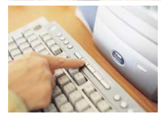
写真のパソコンはFMV-DESKPOWER K8/120WLTです。