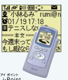
アイポイント i-Point FMV-102(オプション) 標準価格 29,800円(税別)

ワイヤレス携帯ビューワー「i-Point」 11 で、自宅パソコンに届いたEメールをダウンロードすれば、外出先でメールを読むことができます。AzbyClubがお届けするニュースをダウンロードすることもできるため、通勤電車の中で、メール 12 とニュースのチェック、というのはいかがですか？