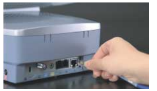
*LANケーブルは添付してありません。

ブロードバンドポート(LAN)を全機種標準装備しているので、高速インターネットに接続OK。音楽や映画のダウンロードをはじめ、動画や対戦型ネットゲームなど大容量コンテンツをスピーディに送受信することができます。これからのインターネットをどうぞお楽しみください。