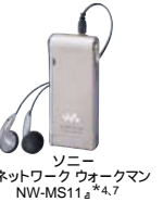
ソニー ネットワークウォークマン NW-MS11 4 *)

パソコンの中の音楽データを「マジックゲートメモリスティック」に転送すれば、ネットワークウォークマンで再生できるので、聴きたい曲を外へ連れ出すことができます。