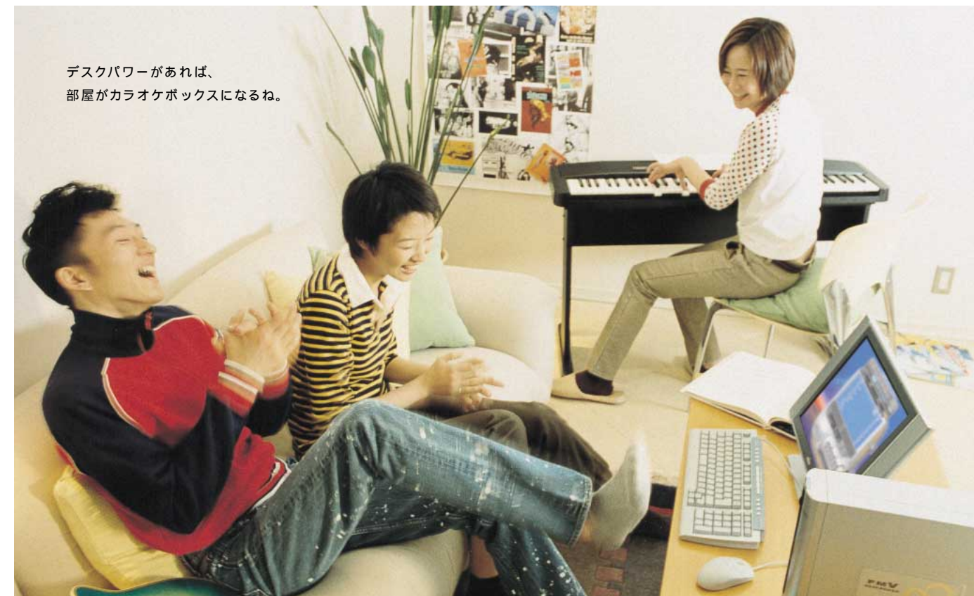
デスクパワーがあれば、 部屋がカラオケボックスになるね。

*1 音楽サイトにより、配信方式が異なるため、ソフトウェアによってはインターネットから音楽データを取り込めない場合があります。 *2 お問い合わせは、ナショナル/パナソニックお客様相談センターへ、フリーダイヤル:0120-878-365 まで受付時間:9:00-20:00 *3 お問い合わせは、ソニーお客様相談センターへ、ナビダイヤル:0570-00-3311(全国どこからでも市内通話料金でご利用いただけます。携帯電話、PHSでのご利用は、03-5448-3311まで。受付時間:月-金 9:00-20:00 土・日・祝9:00-17:00)メモリスティック対応製品については、詳しくは以下のサイトをご覧ください。http://www.memorystick.com/