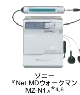
ソニー Net MDウォークマン MZ-N1 4 *)

パソコンの中の音楽データをUSBで接続してMDに簡単に転送できます。好きな曲はとにかくパソコンに保存、あとはお出かけ前に持っていく曲だけ選ぶことができるので手軽に楽しめます。