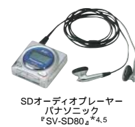
SDオーディオプレーヤー パナソニック SV-SD80 4 *)

パソコンの中の音楽データをSDメモリーカードに転送すれば、SDオーディオプレーヤーで音楽を持ち出すことができます。