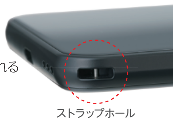
ストラップホール